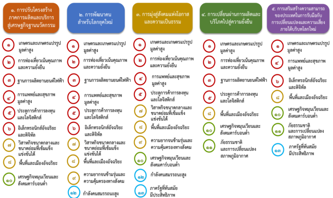
แผนภาพที่ ๓.๑ ความเชื่อมโยงระหว่างหมวดหมู่การพัฒนากับเป้าหมายหลัก

ความเชื่อมโยงระหว่างหมวดหมู่การพัฒนากับเป้าหมายหลักแสดงไว้ในแผนภาพที่ ๓.๑ โดย หมวดหมู่การพัฒนากำหนดขึ้นเป็นประเด็นที่มีลักษณะเชิงบูรณาการที่ครอบคลุมการพัฒนาตั้งแต่ในระดับต้น น้ำจนถึงปลายน้ำ และสามารถนำไปสู่ผลพัฒนาทั้งในมิติเศรษฐกิจ สังคม ทรัพยากรธรรมชาติและสิ่งแวดล้อมไป พร้อมๆ กัน ทำให้หมวดหมู่แต่ละประการสามารถสนับสนุนเป้าหมายหลักได้มากกว่าหนึ่งข้อ นอกจากนี้ การพัฒนาภายใต้แต่ละหมวดหมู่ไม่ได้แยกขาดจากกัน แต่มีการสนับสนุนหรือเอื้อประโยชน์ซึ่งกันและกัน